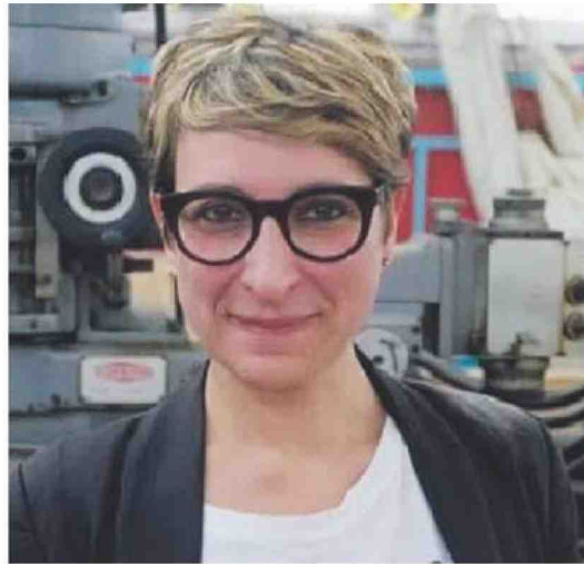
OSPITE La scrittrice salentina Simona Toma